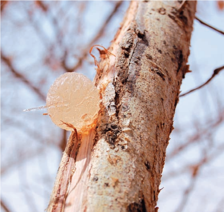
شكلت صمغ افرتها شجرة اكاسيا افريقية

يعدّ السودان أكبر منتج للصمغ العربي في العالم، بمعدل 25 ألف طن سنوياً، ويصدر نحو 85 في المئة من الإنتاج العالمي. لكن، حزام الصمغ العربي، الذي يمتلك السودان 90 في المئة منه فقد نحو 50 في المئة من مساحته خلال العقود الخمسة الماضية، وشهد الإنتاج تراجعاً ملحوظاً نتيجة تغير المناخ وعوامل طبيعية وبشرية.